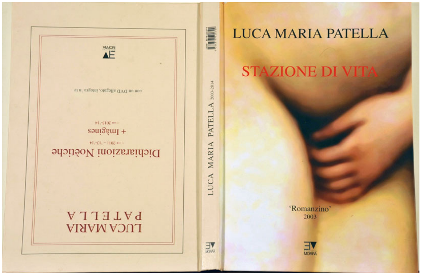
Luca Maria Patella, “libro-lavoro”, bifacce: “Stazione di vita / Dichiarazioni Noëtiche” (un romanzo di 100 pg = in 1 mese / controcaccia teorica di 40 pg = in 8 anni, Morra & Lemme ed. , Napoli, 2015 ('17)